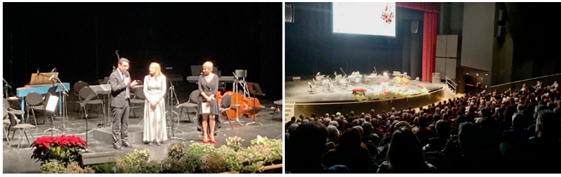
27/11/2022 Thiene - Amiche di Anna Aps - "Ti riguarda... per non dimenticare" progetto scheggedell'Associazione L'Ideazione Complimenti!