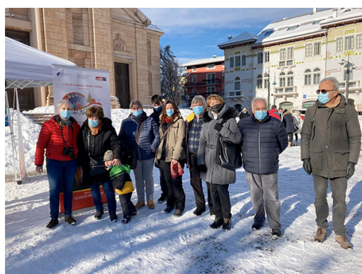
ASIAGO sabato 11 - Piazza Carli

Anche quest’anno, nonostante l’emergenza che stiamo vivendo, abbiamo pensato di organizzare “Il Villaggio del Natale del Dono”, giunto alla sua Quarta Edizione, dal 11 al 24 dicembre 2021 .