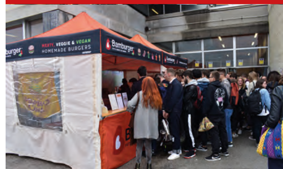
Street Food con Bamburger