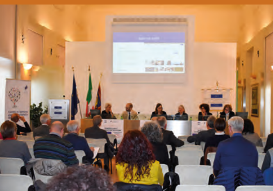
Il pubblico presente al Convegno