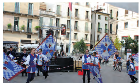
Gli sbandieratori di Piovene Rocchette "Alfieri della Regina"

La Loggia del Capitaniato è stata invece location di prestigio per alcuni momenti ufficiali, come la presentazione della piattaforma web del progetto " RSI una Rete di Servizi Integrati a Sostegno del Territorio ", finanziato dalla Regione Veneto con risorse statali del Ministero del Lavoro e delle Politiche sociali, che ha l'obiettivo di creare un'operatività condivisa per migliorare l'accesso ai servizi di sostegno alle persone in condizione di fragilità e a rischio emarginazione rsi.csv-vicenza.org .