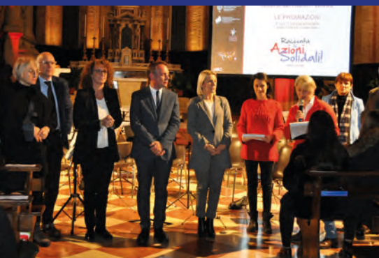
I saluti delle Autorità presenti