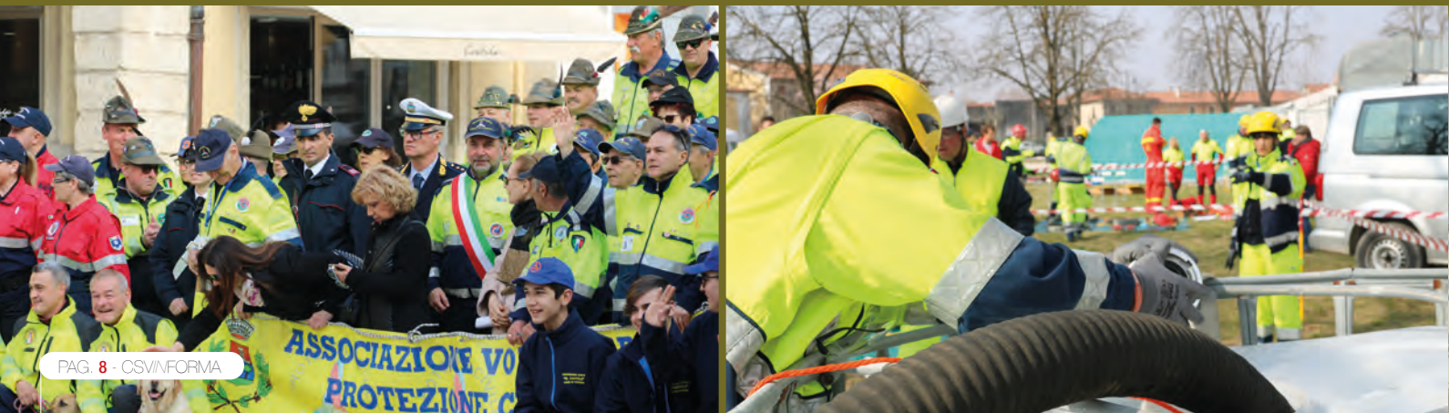
Alcuni momenti della manifestazione del 15, 16 e 17 marzo 2019 a Lonigo