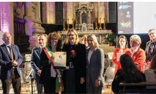
Comitato A.N.D.O.S. OVEST VICENTINO è l'Associazione dell'Anno della Città di Vicenza - www.andosovestvi.it

Una menzione speciale è stata consegnata all' Associazione Vicenza Tutor , che ha raccolto il consenso di tanti cittadini riconoscenti per l'aiuto ricevuto a favore delle persone più fragili e per la valorizzazione delle figure di amministratore di sostegno, tutore e curatore. Molti gli incontri e i corsi gratuiti dedicati a comprendere meglio questi delicati ruoli di aiuto e assistenza.