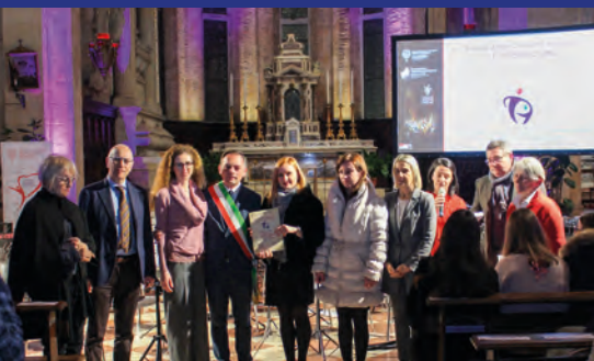
Menzione speciale Associazione dell'Anno della Città a Vicenza Tutor - www.vicenzatutor.it