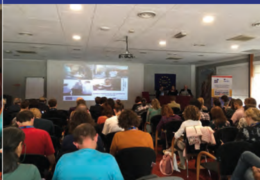
Avvio dei lavori