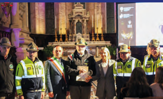
A.N.A. Sezione Vicentina "Monte Pasubio" è l'Associazione dell'Anno della Città di Vicenza - www.anavicenza.it