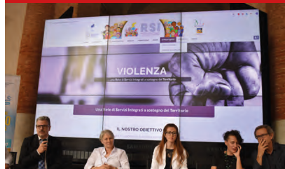
Presentazione della piattaforma rsi.csv-vicenza.org