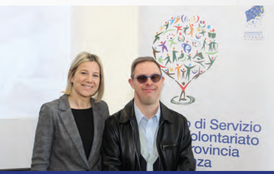
L'Assessore Regionale Manuela Lanzarin con Filippo Roma

Il Convegno "Inserimento lavorativo delle persone con disabilità, esperienze a confronto..." organizzato dal CSV di Vicenza il 30 marzo 2019 nell'ambito della Co-progettazione con il Co.Ge. Veneto "Donare per il tuo domani" , ha proposto dei contenuti quanto mai attuali: esperienze e riflessioni di grande valore. Da recenti statistiche, il nostro Paese può essere preso come riferimento in Europa per il livello di inclusione scolastica e lavorativa delle persone con disabilità: nonostante questo, rimane ancora un generale pregiudizio nel rapporto con la disabilità che deve essere superato. L'evento è stata un'ottima occasione per informare le famiglie, le imprese e i volontari sull'argomento.