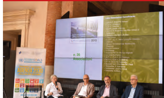
Conferenza stampa con Unisolidarietà Onlus