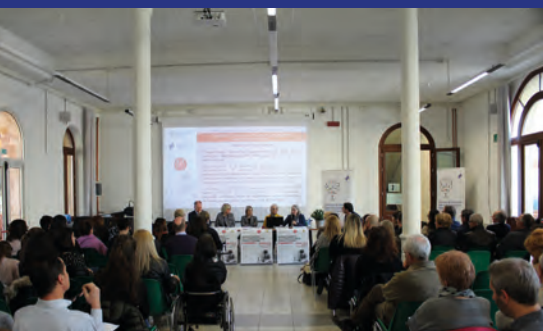
I relatori e il pubblico presente