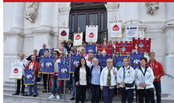
Associazioni con Gagliardetti sulla scalinata del Santuario di Monte Berico