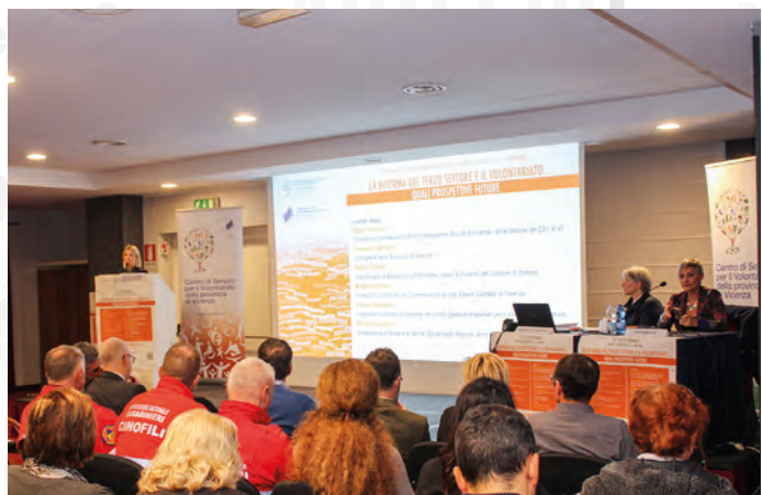
Alcuni momenti del Convegno

È stato molto apprezzato l'intervento del Sociologo Giambattista Sgritta e i numerosi interventi che si sono succeduti hanno messo in evidenza la fatica delle piccole realtà associative rispetto alle organizzazioni più strutturate, sottolineando il problema della rappresentanza del volontariato e la troppa burocrazia.