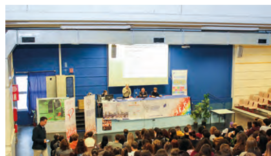
Convegno del 29 ottobre